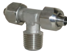
Raccords à montage rapide en acier inoxydable AISI316L, tubes du Ø6 au Ø10 mm, filetages du 1/8" au 1/2"