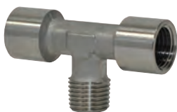
Raccords standard en acier inoxydable AISI316L, filetages du 1/8" au 1/2"