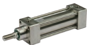
Vérins en acier inoxydable suivant la norme ISO 15552 diamètres du 32 au 125 mm