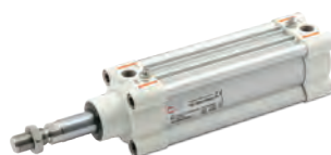
Vérins série HCR (High Corrosion Resistance) suivant la norme ISO 15552 diamètres du 32 au 125 mm