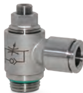
Micro-régulateurs de débit en acier inoxydable AISI316L, filetages du 1/8" au 1/2"