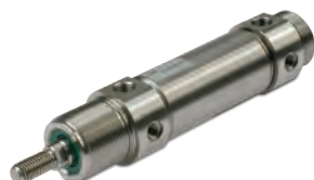
Vérins ronds en acier inoxydable diamètres du 32 au 63 mm