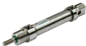
Vérins en acier inoxydable suivant la norme ISO 6432 diamètres du 16 au 25 mm