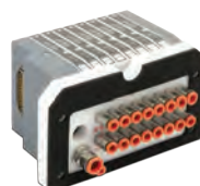
Ilots de distribution pour les zones de projection, série HDM, de 4 à 16 électro distributeurs