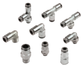
Raccords instantanés en laiton sans plomb série F, tubes du Ø4 au Ø10 mm, filetages du M5 au 1/2"