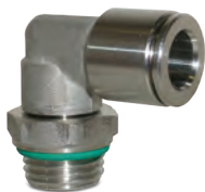
Raccords instantanés en acier inoxydable AISI316L, tubes du Ø4 au Ø12 mm, filetages du M5 au 1/2"