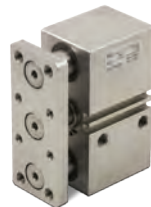
Vérins spéciaux en acier inoxydable