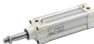
Cilindros serie HCR, High Corrosion Resistance (alta resistencia a la corrosión), norma ISO 15552, diámetros de 32 a 125 mm