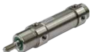
Cilindros en acero inoxidable redondos, diámetros de 32 a 63 mm