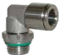
Racores automáticos en acero inoxidable AISI316, tubo de \varnothing 4 a 12 mm, rosca de M5 a 1/2"