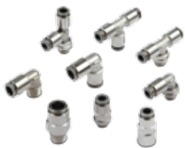
Racores automáticos en latón sin plomo serie F, tubo de \varnothing 4 a 10 mm, rosca de M5 a 1/2"