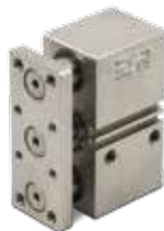
Cilindros especiales en acero inoxidable