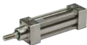
Cilindros en acero inoxidable norma ISO 15552, diámetros de 32 a 125 mm