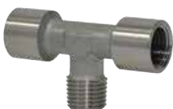
Racores estándar en acero inoxidable AISI316, roscas de 1/8" a 1/2"