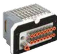
Islas de electroválvulas para área Splash, serie HDM, de 4 a 16 electroválvulas