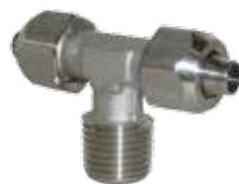
Racores de enchufe semirápido en acero inoxidable AISI 316, tubo de \varnothing 6 a \varnothing 10 mm, rosca de 1/8" a 1/2"