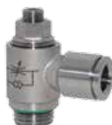
Reguladores de caudal en acero inoxidable AISI 316, roscas de 1/8" a 1/2"