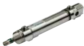
Cilindros en acero inoxidable norma ISO 6432, diámetros de 16 a 25 mm